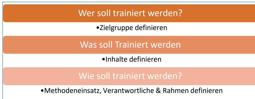
Abbildung 2 Strukturierte Definition der Qualifizierungsmaßnahmen